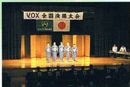
▲平成21年度・ヴォックス吟詠コンクール 全国決勝大会・東京・江戸博物館ホール