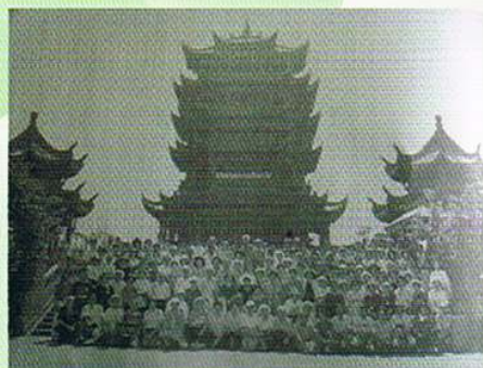
漢詩の舞台を巡る 白帝吟行の旅 武漢—黄鶴楼 平成9年1997.8.23~30