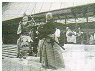
▲ 昭和62年1987・1・19 フランス・ニース 日仏親善文化交流使節団