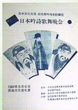
昭和59年1984・9・6 ヴォックスレコード吟詠会 創立5周年記念 日中親善吟詠大会