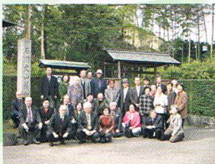
▲平成19年3月2日 全国執行部会議の翌日観光 岡崎・丈山苑