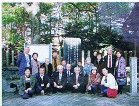
▲平成21年2月28日 全国執行部会議の翌日観光