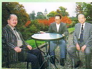
▲ 平成11年1999・10・22 フランス・エビアン公演