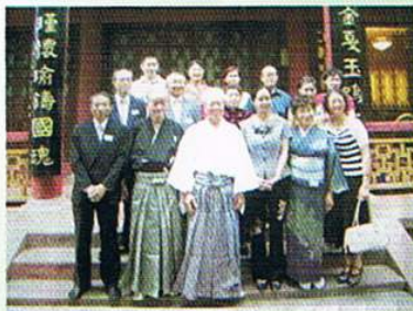
▲平成18年2006・6.22～28 ヴォックス音楽吟詠会 創立25周年記念 李白故里吟行