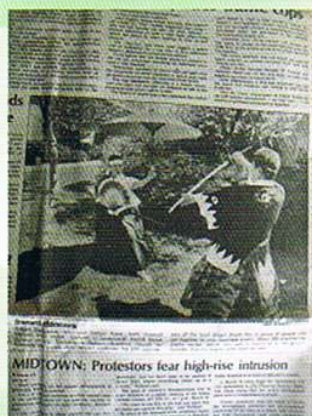
昭和62年1987・5.22 ヴォックス吟詠会10周年記念 ヨーロッパ・アンコール公演 現地新聞に掲載