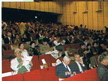
▲平成19年2007・11.23 姫路・名流大会は、大盛況でした