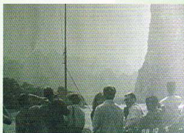
平成9年1997・8.26 長江の景勝地・三峡下り くどうきょう ふきょう せいりょうきょう (瞿塘峡・巫峡・西陵峡)